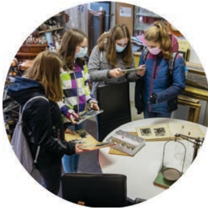
Links: Test-Filmen im Brockenhaus während der Pandemie

Wichtige Lernorte sind die Wohnungen der Zeitzeugen, welche die Lernenden im Laufe des Projektes zweimal besuchen. Weitere exotische Lernorte sind die lokalen Brockenhäuser und Museen, wo das Test-Filmen stattfindet.