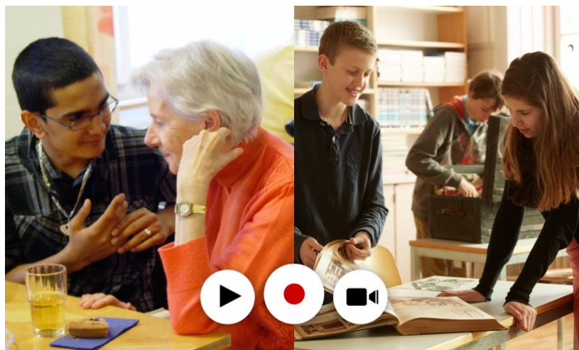
Interview, Quellenarbeit und die Knöpfe der App 'Z-moviemaker'

Schüler:innen recherchieren, Interviewen und filmen. Zu zweit besuchen sie Zeitzeug:innen und erfassen deren Erzählungen als Tonspuren. Beim Zweitbesuch verarbeiten sie Ausschnitte daraus zu 1 bis 4 Min. mit unserer Film-App und den Fotoalben der über 60-Jährigen zu Filmen und publizieren diese.