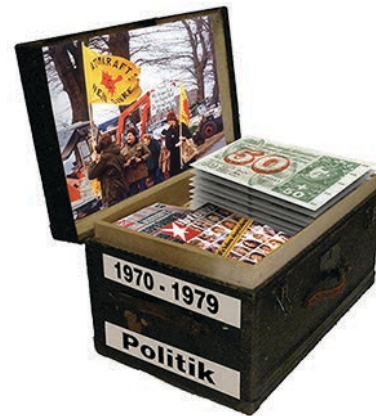
Rechts: Kiste mit Quellen für die Projektarbeit an den Schulen